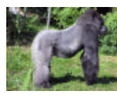
Gorilla gorilla (gorila)