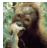
Pongo pygmaeus (orangután)