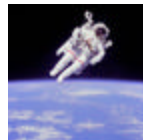
Homo sapiens (humano)